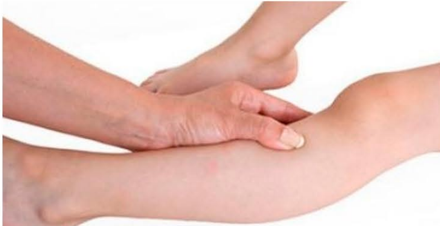
Institut Delatte : la PBA, une méthode thérapeutique inspirée de l'acupuncture